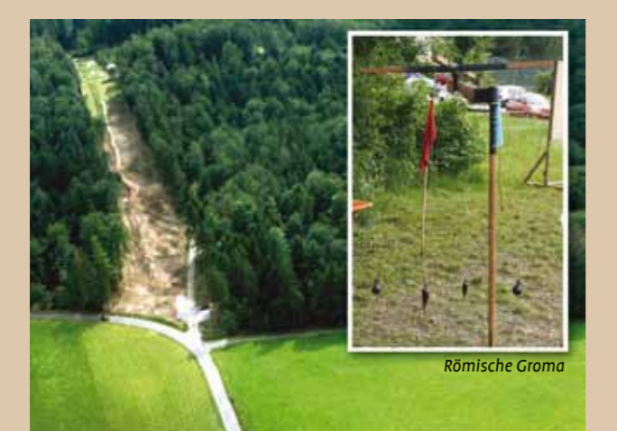
Freigelegte Limeslinie beim Wachturm am Heidenbuckel bei Großlärach/Grab

Der Limes verlief im Rems-Murr-Kreis bis zum Haghof auf einer schnurgeraden Linie. Bis heute gibt diese Vermessungskunst noch immer Rätsel auf. Das Abstecken der Limes-Geraden stellte organisatorisch und technisch eine bemerkenswerte Leistung römischer Vermesser (agrimensores) dar. Wichtigstes Instrument war ein Visiergerät (groma) zum Messen rechter Winkel, der Nord-Süd- (cardines) und Ost-West-Achsen (decuman). Die groma bestand aus einem Eisengestell, auf dem der Winkelmesser (tetras) angebracht war. Der tetras war aus zwei sich im rechten Winkel kreuzenden Armen konstruiert, an deren Enden Gewichte hingen. Für die Anlage linearer Trassen und Straßen war die groma optimal geeignet.