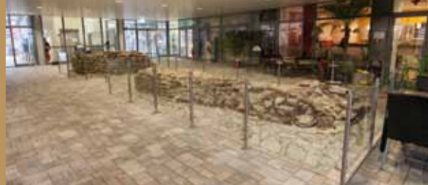
Die restaurierten Fundstücke im Ärztehaus

Spannend für die Archäologen war die Entdeckung eines großen Kanals, der unter einem nebenstehenden Gebäude verläuft und weit mehr Wasser aufnehmen kann als im römischen Badebetrieb eigentlich anfiel. Dies deutet auf eine Art Entwässerungsanlage hin, ein Novum für ein militärisches Römerbad.