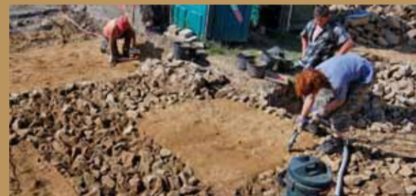
Ausgrabungen am Westkastell