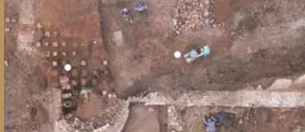
Die Ausgrabungen aus der Vogelperspektive